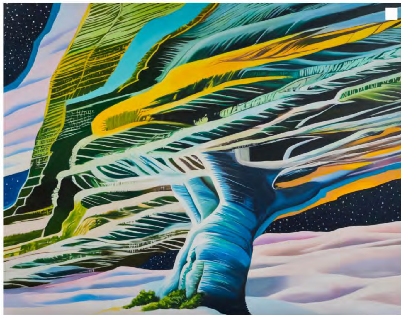
朱丽晴，《如果可以我很愿意与暴风雨共舞》，2023 布面油画，190×243cm 点击图片了解作品详情

展题的由来也与她对电子时代的反思有关。当今社会人们在观看电子屏幕的过程中，看似占据主导权，实则在看的过程中也在被动接受着媒体的信息洗礼。