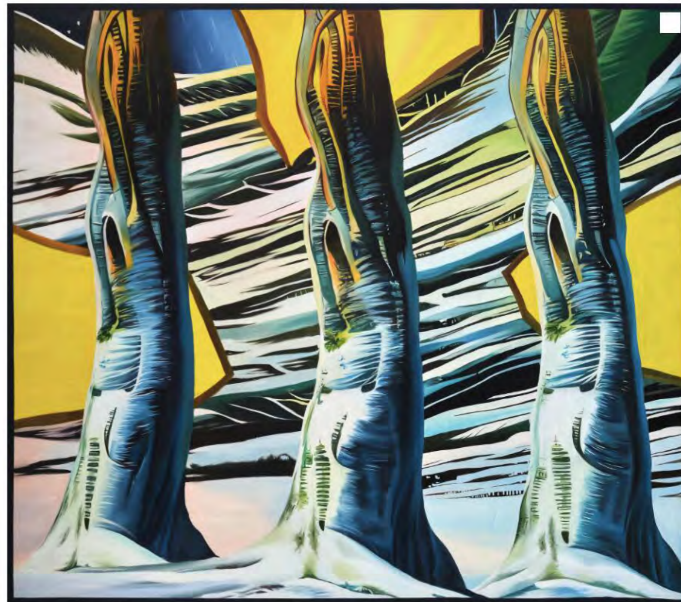
朱丽晴，《午夜三重奏》，2023 布面油画，152×173cm 点击图片了解作品详情

作品中抽动的线条与迷幻的色彩其实是在表达‘闪屏’的概念，人们长时间沉迷于手机、电脑等屏幕，逐渐脱离自然。树木的意象也隐含了希望人们凝视自然、重新与自然联结的寓意。